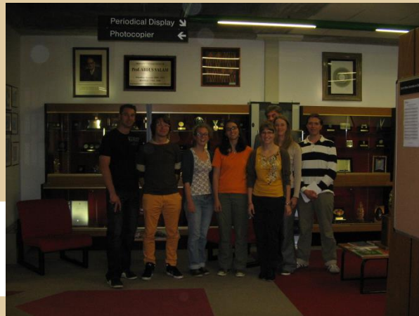
... hier in der Bibliothek des International Centre for Theoretical Physics in Triest ...