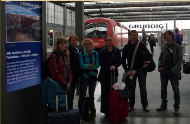
... Leute wie wir: der Kurs Q3 2011/2014 an der FHVR-Fachbereich AuB,