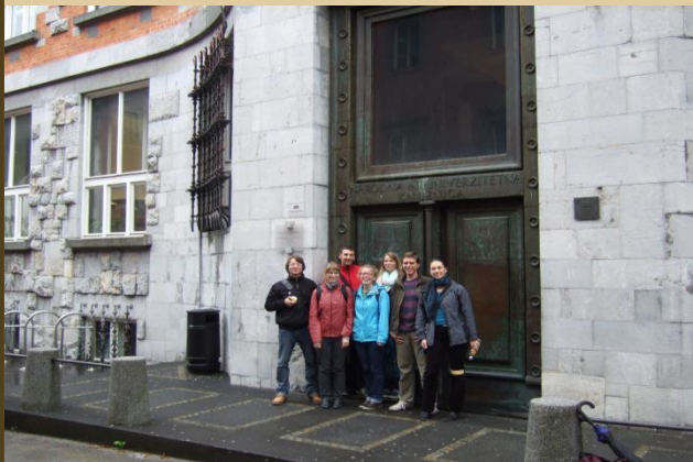
... und vor der Universitätsbibliothek in Ljubljana.

Fachhochschule für Öffentliche Verwaltung und Rechtspflege | Fachbereich Archiv- und Bibliothekswesen: Diplomierungsfeier des Kurses Q3 2011/2014 am 28.11.2014 um 15.00 Uhr im Gärtnersaal der Bayerischen Staatsbibliothek / Fachhochschule für Öffentliche Verwaltung und Rechtspflege. – München: FHVR AuB Press, 2014. – 4 S. : überw. Ill. – (Diplomierungsfeiern; ...)